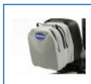
Scooter Tasche für die Rückenlehne